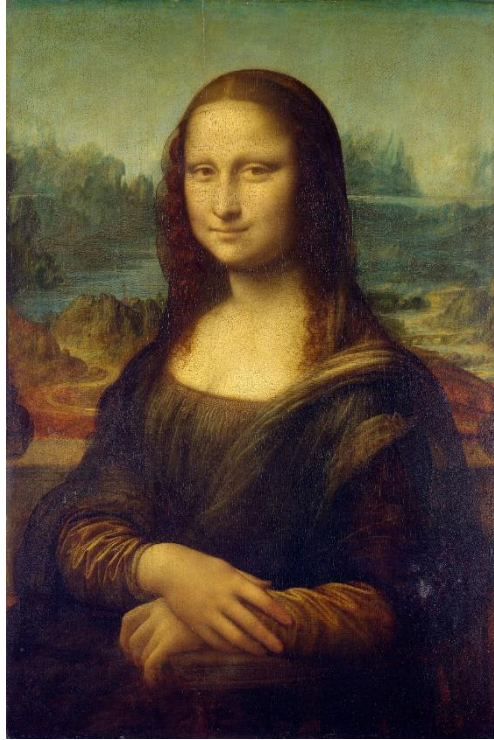
La Joconde (ou Mona Lisa)